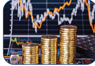
Menkul Kıymetler ve Sermaye Piyasası