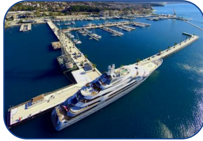
Marina ve Yat İşletmeciliği