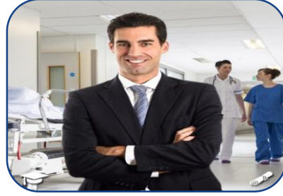
Sağlık Kurumları İşletmeciliği