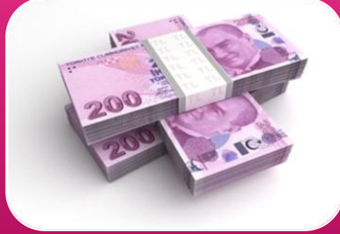
Mali Nitelikli İşlem Ve Olaylarını