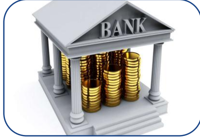
Bankacılık ve Sigortacılık