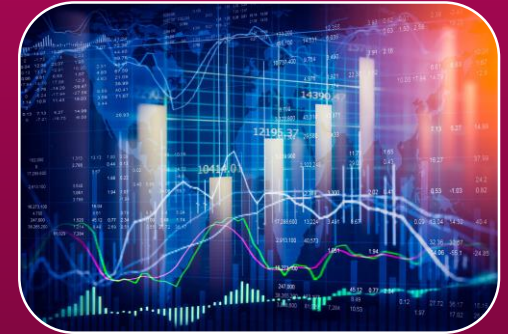
Finans ve Borsa Hizmetleri

Yeterliklerini kazandırmaya yönelik eğitim ve öğretim vermektedir.