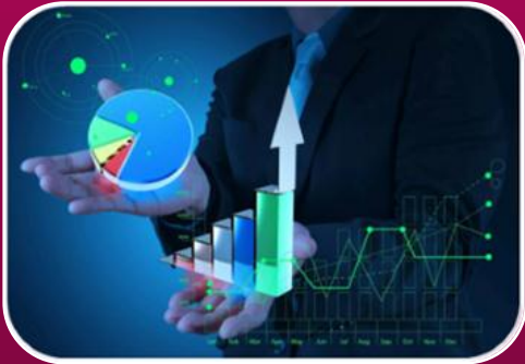
Analiz Ederek Yorumlama