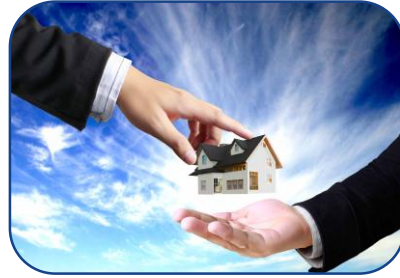
Emlak ve Emlak Yönetimi