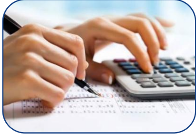
Muhasebe ve Vergi Uygulamaları