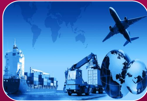
Dış Ticaret Mevzuatı