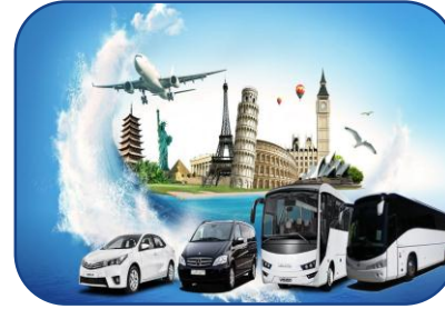
Turizm ve Seyahat Hizmetleri