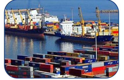
Deniz ve Liman İşletmeciliği